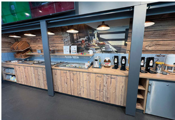
Foto der Buffet-Theke der BFT Station im Nahetal

Besteuerung ein Ende hat! Letztendlich hat die arbeitende Bevölkerung, die täglich auf ihren PKW angewiesen ist um arbeiten zu gehen, immer mehr zu tragen. Und das kann so nicht weiter gehen! Alles andere regelt die politische Großwetterlage in der Welt – da haben weder die Mineralölgesellschaften und auch die deutschen Politiker dann keinen Einfluss mehr. TZ: Was würden Sie tun, um die Preise für die Kunden erträglicher zu machen? SP: Ich würde die CO 2 -Preiserhöhung, die seit Anfang 2026 gilt, wieder rückgängig machen. Dann würde ich die Markpreistransparenz-Stelle abschaffen damit sich der Markt wieder selbst regulieren kann. Als dritten Punkt würde ich die Mehrwertsteuer nur auf das Produkt aber nicht auf die darauf berechnete Steuer berechnen. Damit wären wir beim oben aufgeführten Rechenbeispiel wieder unter 1,40 Euro für einen Liter Otto-Kraftstoff. TZ: Vielen Dank für Ihre Zeit und bis zur nächsten Ausgabe der TaRa-Zeitung.