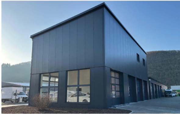
Die Jochen Laub GmbH hat für eine Million Euro eine neue Halle im Gewerbepark Nahetal errichtet.